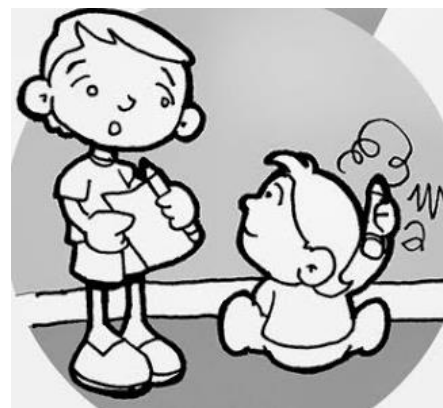
AMMONIRE I PECCATORI