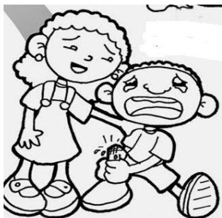
CONSOLARE GLI AFFLITTI