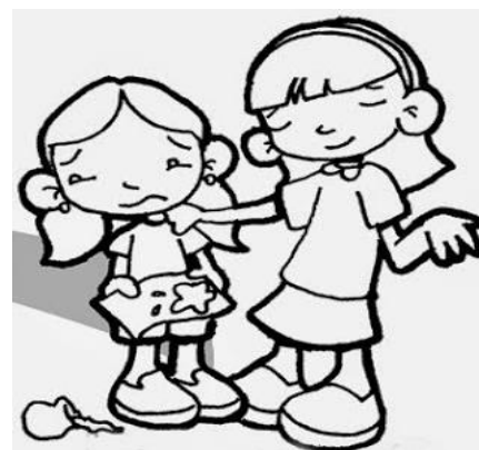
SOPPORTARE PAZIENTEMENTE LE PERSONE MOLESTE