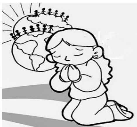
PREGARE DIO PER I VIVI E PER I MORTI