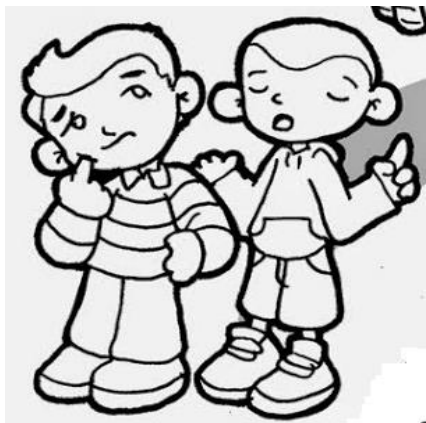
CONSIGLIARE I DUBBIOSI