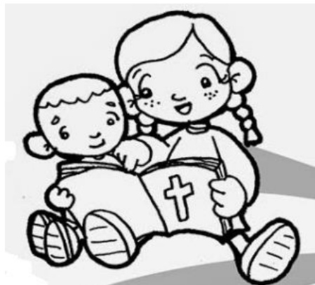
INSEGNARE AGLI IGNORANTI